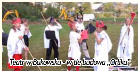
Teatr w Bukowsku - w tle budowa „Orlika”

bieżącym dzięki pozyskaniu środków pozabudżetowych, jak i zaangażowaniu środków własnych, zrealizowaliśmy kilka zadań o kapitalnym znaczeniu. Jako pierwsze zadanie należy wymienić oddanie do użytku ostatniego segmentu Zespołu Szkół w Nowotańcu. Oddana została sala gimnastyczna z zapleczem socjalnym, biblioteka, salka do rehabilitacji, pracownia komputerowa i zaplecze administracyjne. Budynek z ukończoną