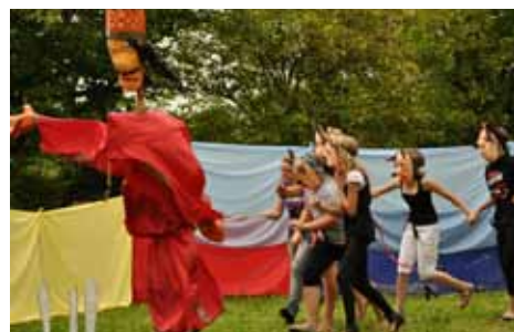
uczestnicy warsztatów teatralnych

ukraińskie i słowackie legendy. Występ grupy teatralnej przed zaproszonymi gośćmi oraz międzynarodową publicznością artystów przebywających na plenerze w Uniwersytecie Ludowym wywoływał atmosferę pełną napięcia i humoru. To zadziwiające, że w tak krótkim czasie ci młodzi ludzie potrafili stworzyć, pod opieką Mistrza Jerzego, to niecodzienne widowisko. W takich działaniach liczy się pasja i pewnego rodzaju dyscyplina. Trzeba woli tworzenia i wrażliwości, aby zrodziła się magiczna przestrzeń teatru. Gorące brawa dla aktorów oraz wilkołaków, książąt, myszy i czarownic, pięknych białogłów i dzielnych rycerzy! Zajęcia teatralne były częścią bogatej oferty zajęć artystycznych dla dzieci i młodzieży gminy Bukowsko or-