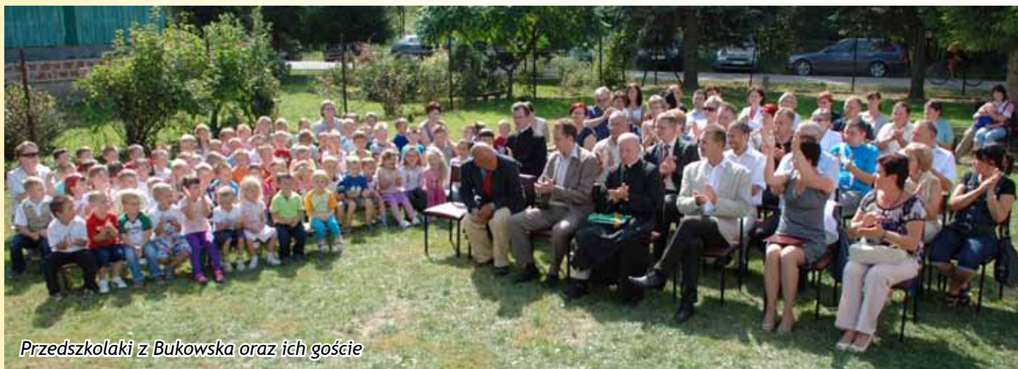
Przedszkolaki z Bukowska oraz ich goście