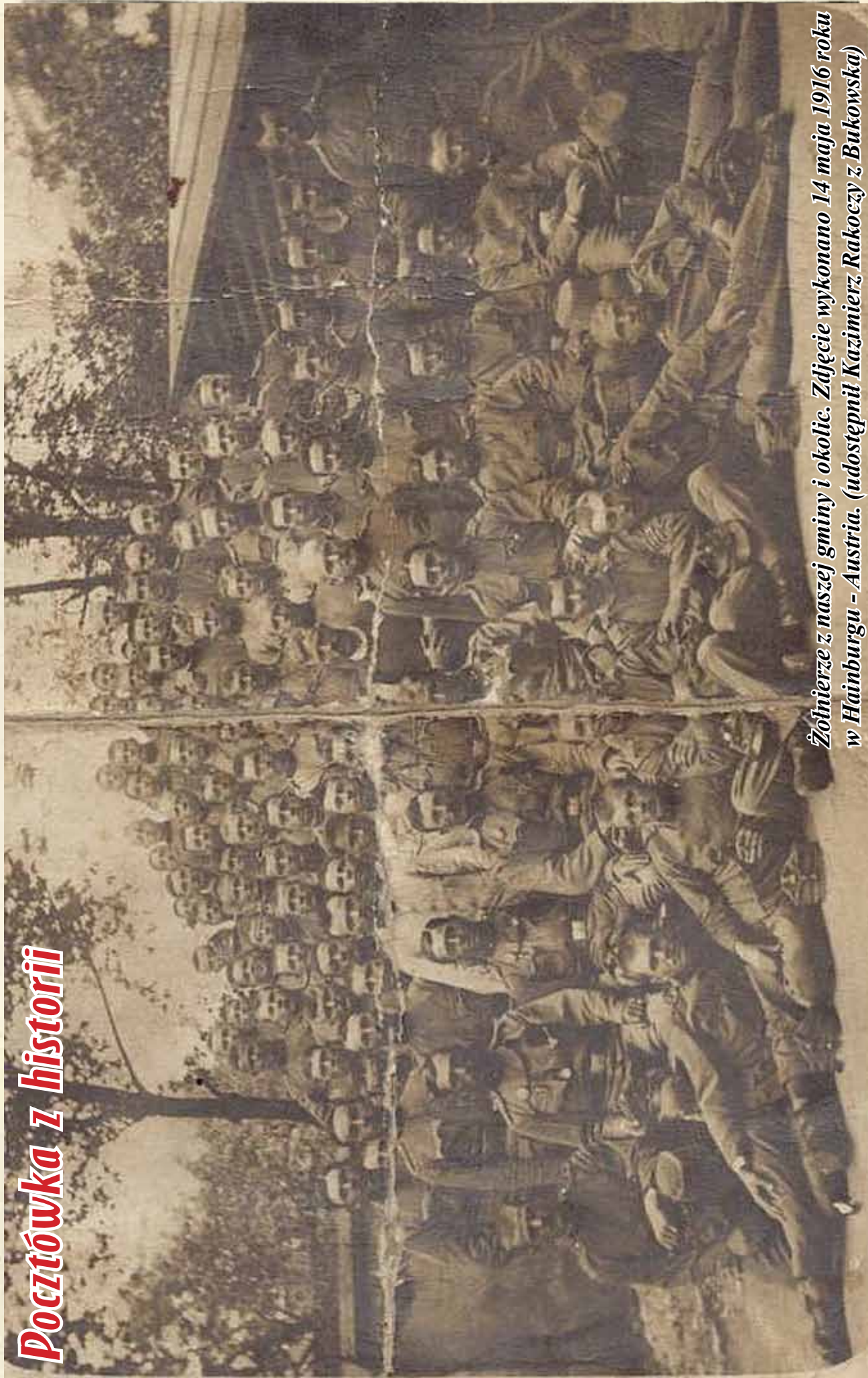
Żołnierze z naszej gminy i okolic. Zdjęcie wykonane 14 maja 1916 roku w Hainburgu - Austria.