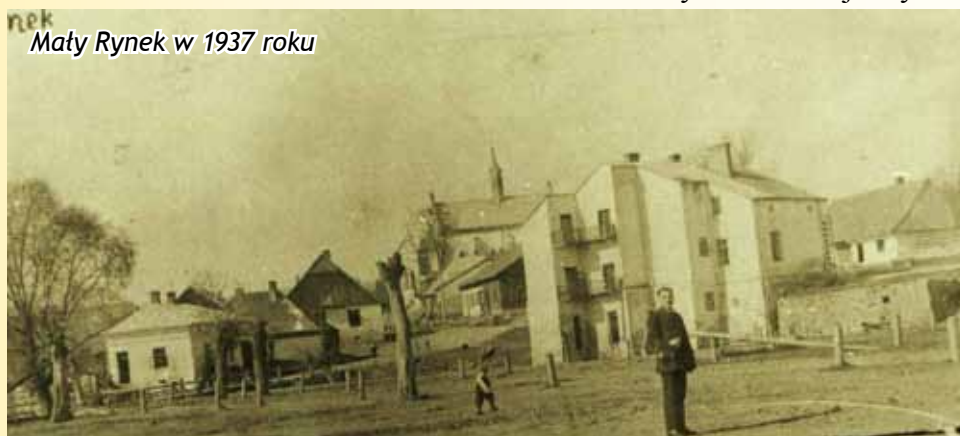
Maty Rynek w 1937 roku