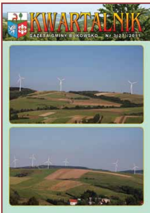
Okładka: Wiatraki firmy Martifer