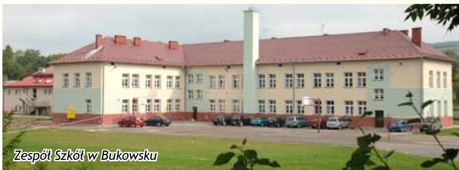
Zespół Szkół w Bukowsku

cje wodno kanalizacyjne, elektryczne, a ściany zostały wyłożone nowymi płytkami. W kuchni został zamontowany nowoczesny i oczywiście nowy sprzęt zakupiony w roku ubiegłych. Inna sytuacja miała miejsce w Pobiednie, gdzie w całkiem nowym obiekcie nastąpiła nieoczekiwana awaria i sala gimnastyczna przy Zespole Szkół została wyłączona z użytkowania. Podłoga wykonana w sali gimnastycznej okazała się wadliwa i wykonawca w ramach gwarancji przystąpił do jej naprawy. Podłoga w tej sali będzie zupełnie nowa. W wyniku naszych, kolejnych wniosków pozyskaliśmy również dotację na budowę „Mojego Boiska – „ORLIK” w Bukowsku. Dotacja wynosi 833 tysiące złotych i zadanie będzie zrealizowane w roku bieżącym, zgodnie z wcześniejszymi zapowiedziami. Na wykonawcę inwestycji w drodze przetargu nieograniczonego, została wyło-