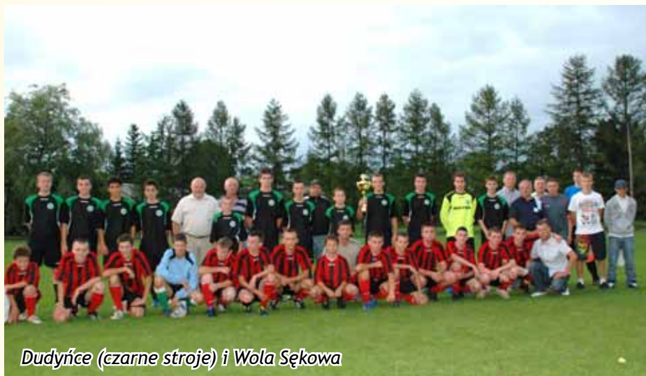
Dudyniec (czarne stroje) i Wola Sękowa