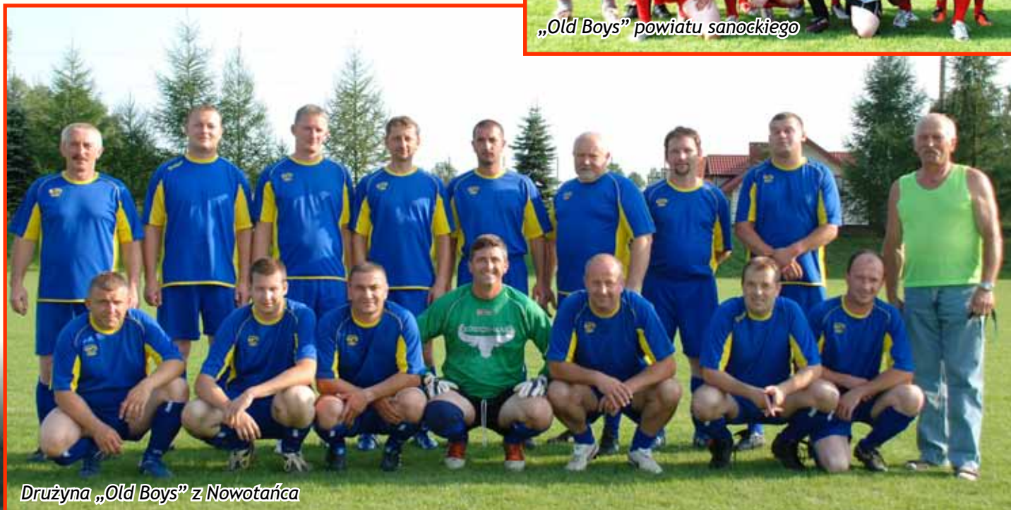
Drużyna „Old Boys” z Nowotańca