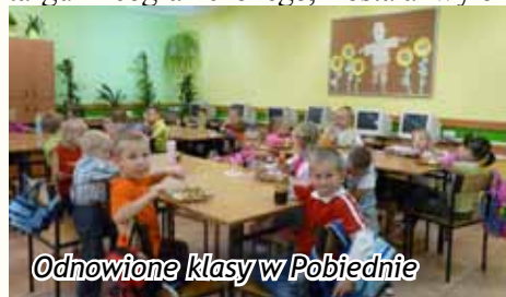
Odnowione klasy w Pobiednie

cje wodno kanalizacyjne, elektryczne, a ściany zostały wyłożone nowymi płytkami. W kuchni został zamontowany nowoczesny i oczywiście nowy sprzęt zakupiony w roku ubiegłych. Inna sytuacja miała miejsce w Pobiednie, gdzie w całkiem nowym obiekcie nastąpiła nieoczekiwana awaria i sala gimnastyczna przy Zespole Szkół została wyłączona z użytkowania. Podłoga wykonana w sali gimnastycznej okazała się wadliwa i wykonawca w ramach gwarancji przystąpił do jej naprawy. Podłoga w tej sali będzie zupełnie nowa. W wyniku naszych, kolejnych wniosków pozyskaliśmy również dotację na budowę „Mojego Boiska – „ORLIK” w Bukowsku. Dotacja wynosi 833 tysiące złotych i zadanie będzie zrealizowane w roku bieżącym, zgodnie z wcześniejszymi zapowiedziami. Na wykonawcę inwestycji w drodze przetargu nieograniczonego, została wyło-