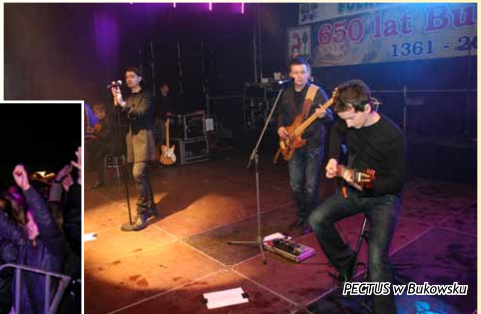
PECTUS w Bukowsku