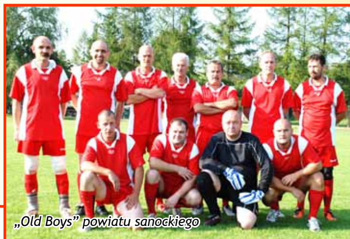
„Old Boys” powiatu sanockiego