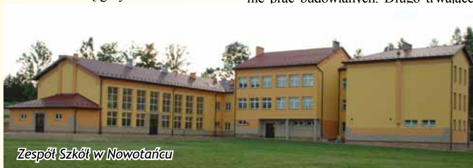
Zespół Szkół w Nowotańcu

elewacją i kostką na parkingu prezentuje się okazale, a wykonane prace odznaczają się wysokim standardem. Pozytywnie rozpatrzony został wniosek naszej gminy złożony w Ministerstwie Edukacji Narodowej na wyposażenie oddanych do użytku pomieszczeń i otrzymaliśmy środki w wysokości 100 tysięcy złotych. Łącznie na realizację tego zadania, na przestrzeni trzech lat realizacji otrzymaliśmy prawie 1 milion złotych. Jeżeli chodzi o inne budynki oświatowe, warto wspomnieć, że w Zespole Szkół w Bukowsku został przeprowadzony remont generalny podłóg, a całość wnętrza szkolnych została pomalowana. Podobny zakres prac został wykonany w Zespole Szkół w Pobiednie. Łączna wartość tych prac opiewa na kwotę 291 tysięcy złotych. Na ten cel otrzymaliśmy dotację z Ministerstwa Edukacji Narodowej w Warszawie w kwocie 230 tysięcy złotych. W czasie prowadzenia remontów zaszła konieczność wykonania prac dodatkowych, nieprzewidzianych w kosztorysach inwestorskich i tych, które są niezbędne, aby remont miał kompletny charakter, jak na przykład wymiana barierki schodowych, wykonanie parapetów itp. Środki na ten remont były przekazane Gminie w drugiej połowie lipca i dopiero wtedy mogliśmy ogłosić przetarg na wykonanie prac budowlanych. Długo trwające