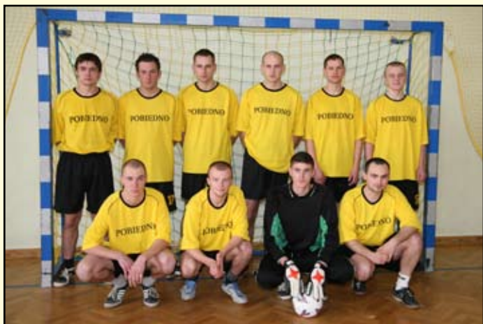
4 miejsce Dudyńce