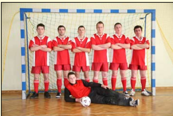
7 miejsce Nadolany