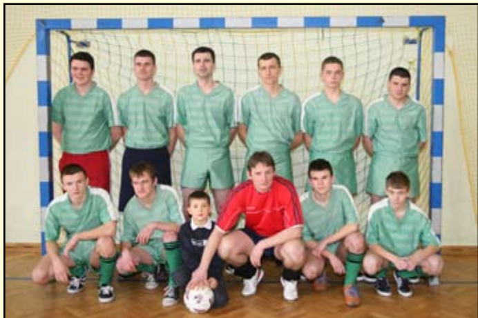
2 miejsce Nowotańcie