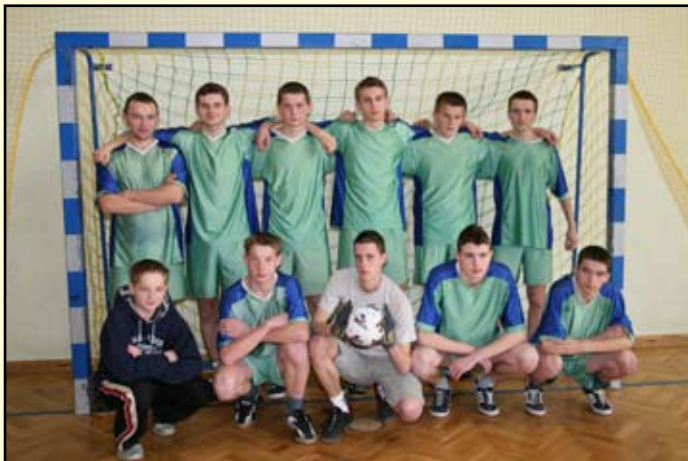
6 miejsce Bukowsko - Ultras