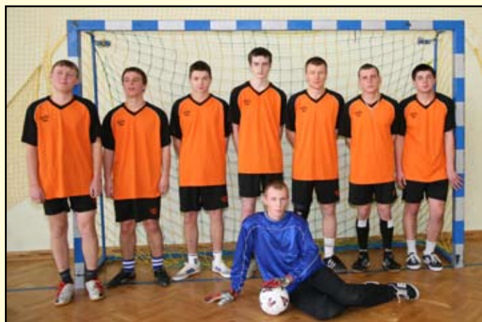
1 miejsce Bukowsko I