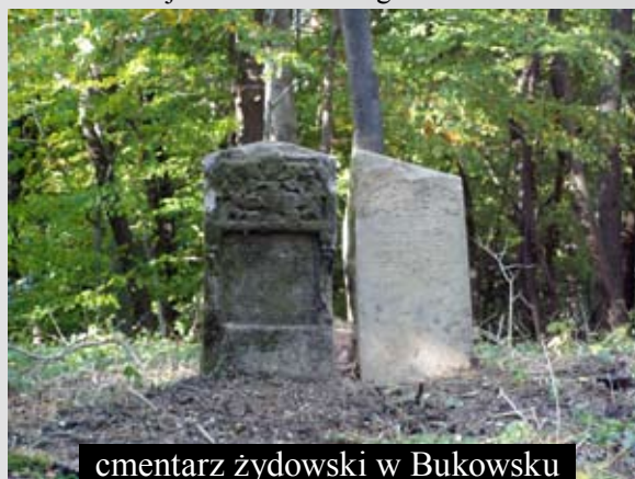
cmentarz żydowski w Bukowsku