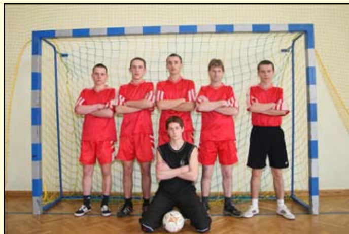
9 miejsce Tokarnia