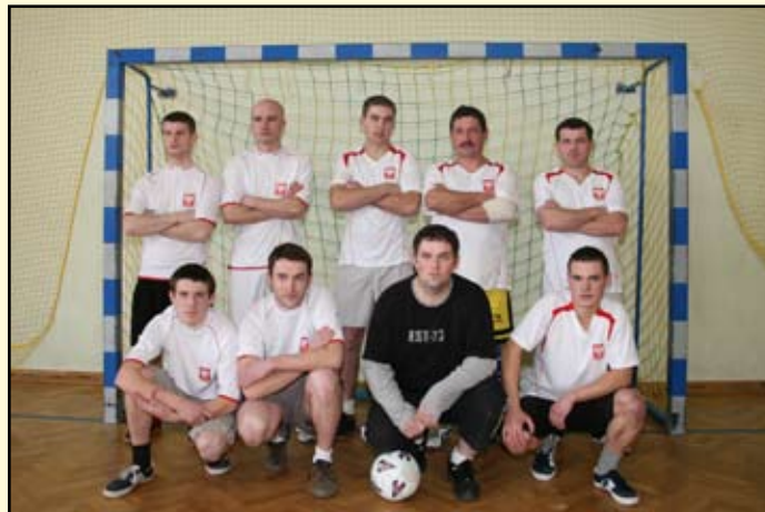
10 miejsce Wolica