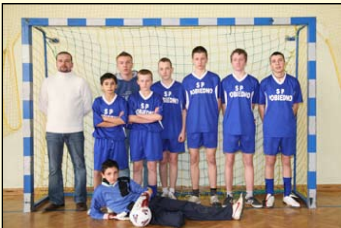
8 miejsce Pobiedno