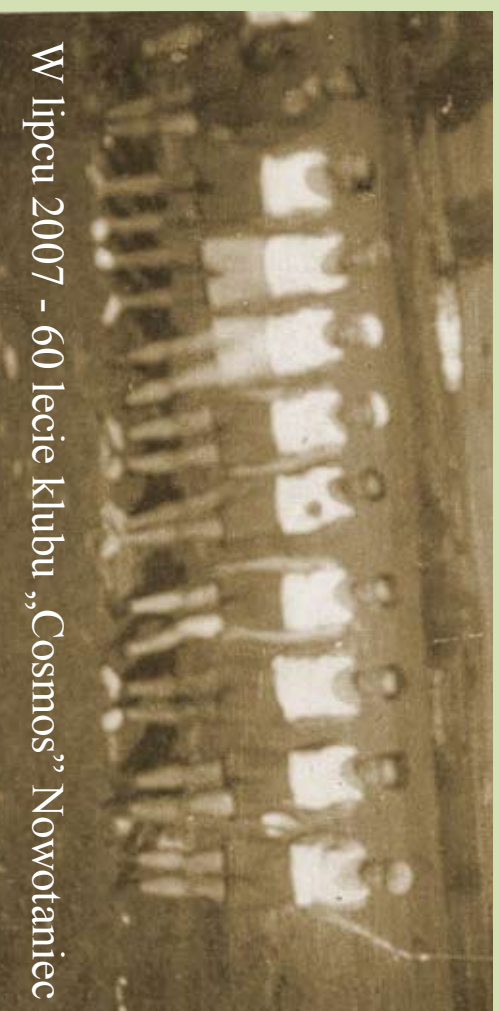
W lipcu 2007 - 60 lecie klubu „Cosmos” Nowotaniec