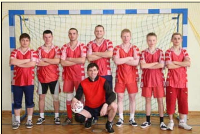
5 miejsce Nagórzany