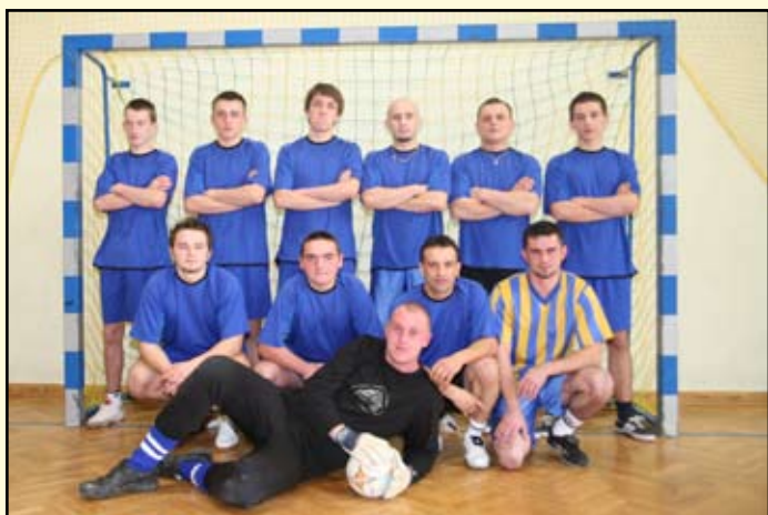
3 miejsce Bukowsko II